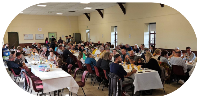
Plus de 110 marcheurs ont foulé les sentiers de la commune