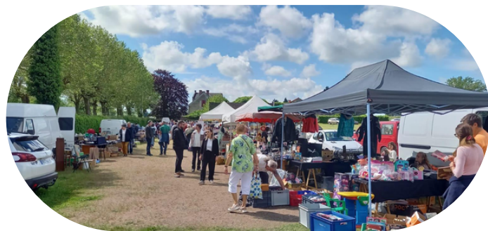
3 jours rythmés avec soirée dansante, brocante et foire aux moutons