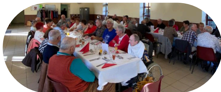
47 aînés présents pour partager le repas concocté par le restaurant "L'Étoile d'Urçay"