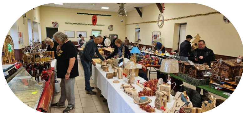
18 exposants variés ont exposé leur création