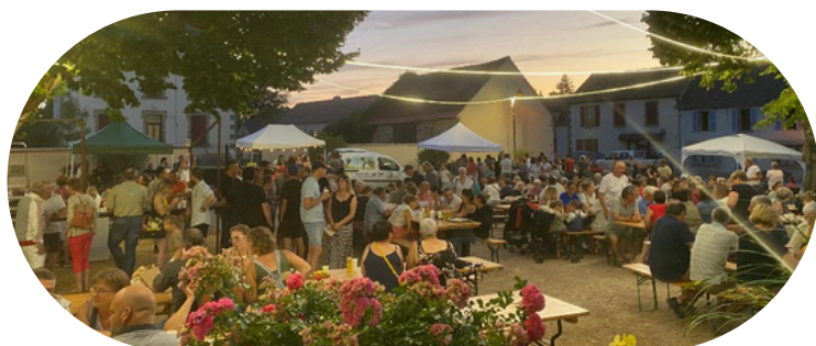
480 repas servis sur place et plus de 500 visiteurs.