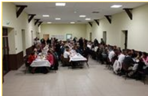
Soirée escargots Mai 2015