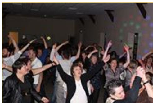
Soirée de la mer, novembre 2015