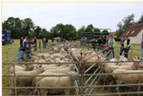
Foire aux moutons Mai 2015